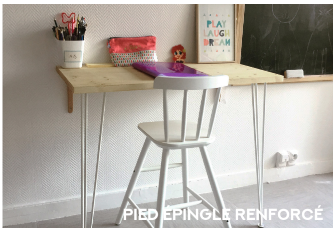
PIED ÉPINGLE RENFORCÉ