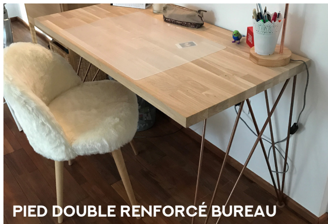
PIED DOUBLE RENFORCÉ BUREAU